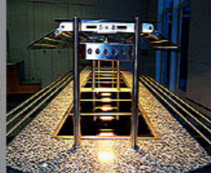
Bosch Entwicklungszentrum, Abstatt 2003