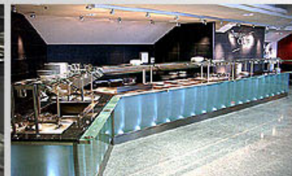
SAP Arena, Mannheim 2005