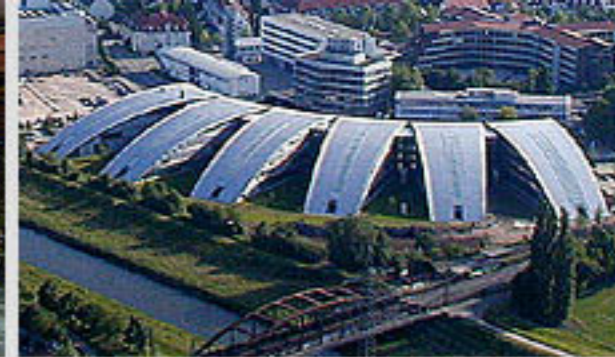
Burda Medienpark, Offenburg 2005; Burda, München 2007