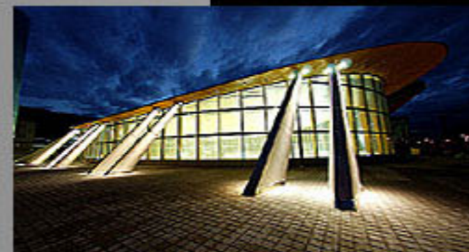
Olympia Eislauhalle, Innsbruck-Österreich 2005