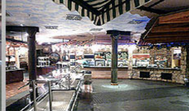
US Army, Edelweiss Lodge and Resort, Garmisch-Partenkirchen 2009+2010