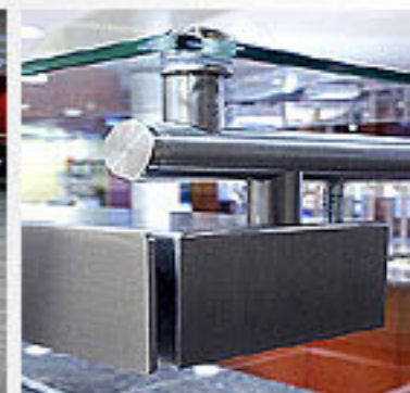
Wella AG, Darmstadt 2003