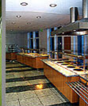
SAP-St, Waldorf 2003