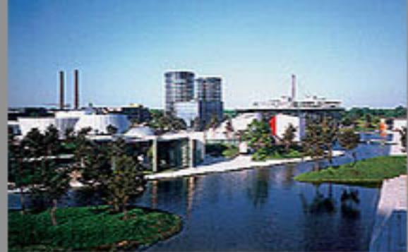
VW Autostadt, Wolfsburg 2003+2008