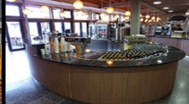
Zoo Wilhelma, Stuttgart 2011