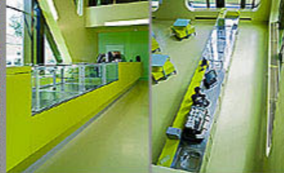
Fachhochschule, Karlsruhe 2007