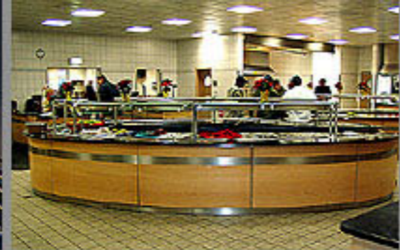
US Army Medical Center, Landstuhl 2007